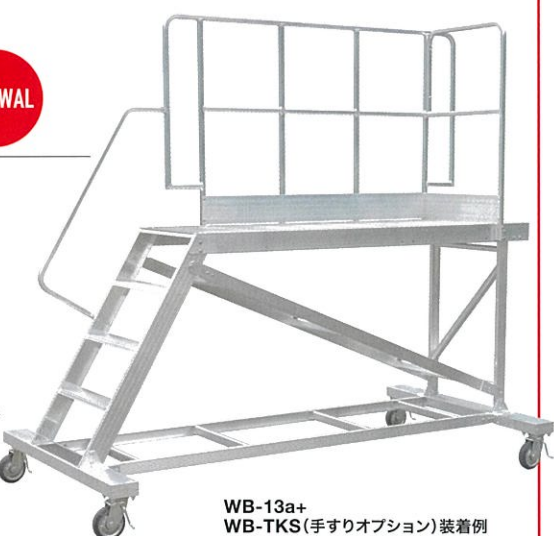
WB-13a+ WB-TKS(手すりオプション)装着例

連結方法 蝶ボルトで固定、 連結したまま 移動が可能。 (本体への 穴あけ加工なし)